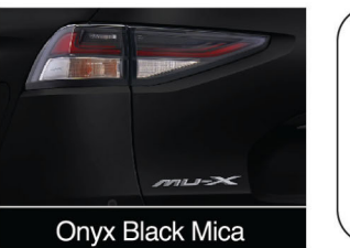
Onyx Black Mica