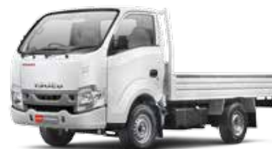
Pick Up (FD)